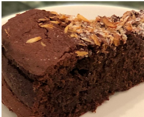
TORTA ALLA CAPRESE