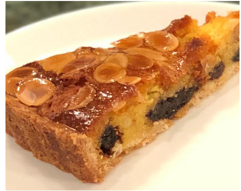
TORTA ALLA BOSCAIOLOA